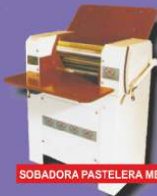
SOBADORA PASTELERA MEDIANA