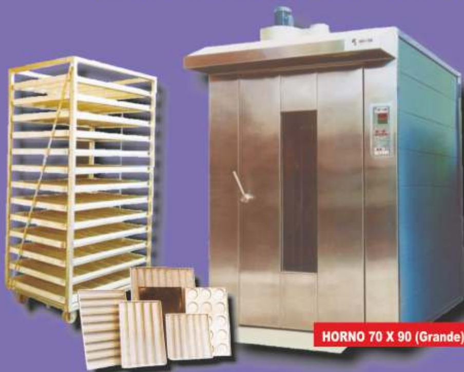
HORNO 70 X 90 (Grande)

www.rotcarr.com.ar - E-mail: rotcarr@rotcarr.com.ar