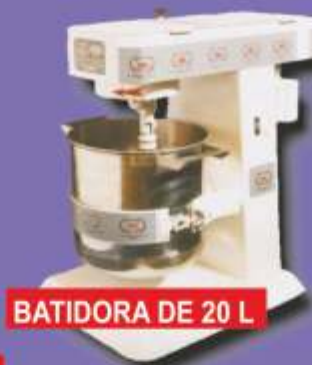
BATIDORA DE 20 L