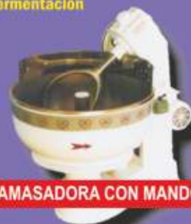
AMASADORA CON MANDO